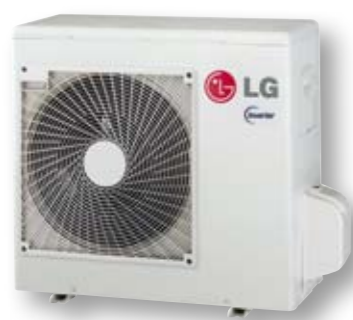
Buitenunit (Multi Split)